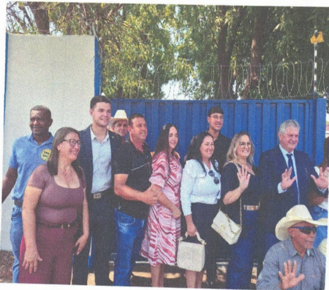
11h30 – Almoço.

Ressalta-se a importância da UCMMAT como instituição representativa, responsável por fortalecer a autonomia municipalista e oferecer suporte às Câmaras Municipais de todo o estado.