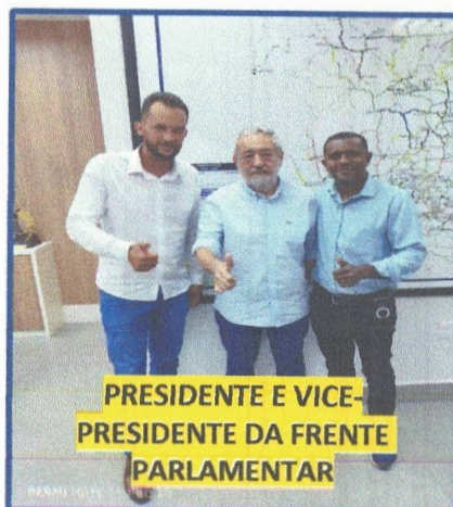
PRESIDENTE E VICE- PRESIDENTE DA FRENTE PARLAMENTAR