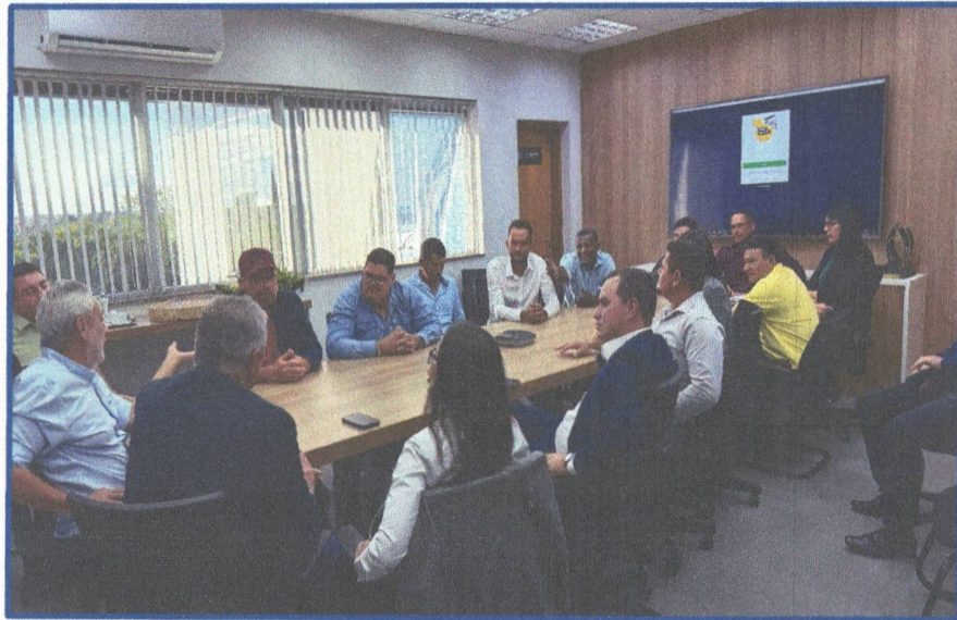
Fotos Reunião da Frente Parlamentar do Noroeste SINFRA /MT

Câmara Municipal de Juína - MT PROTOCOLO GERAL 752/2025 Data: 05/05/2025 - Horário: 12:46 Administrativo - PC/DIA 64/2025