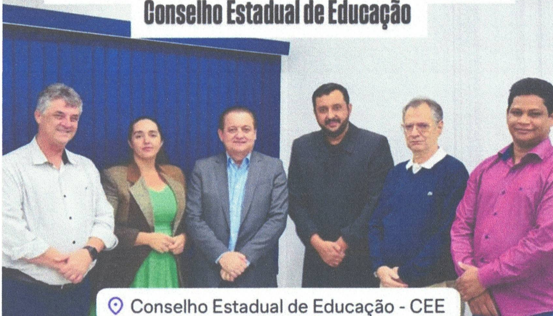
📍 Conselho Estadual de Educação - CEE