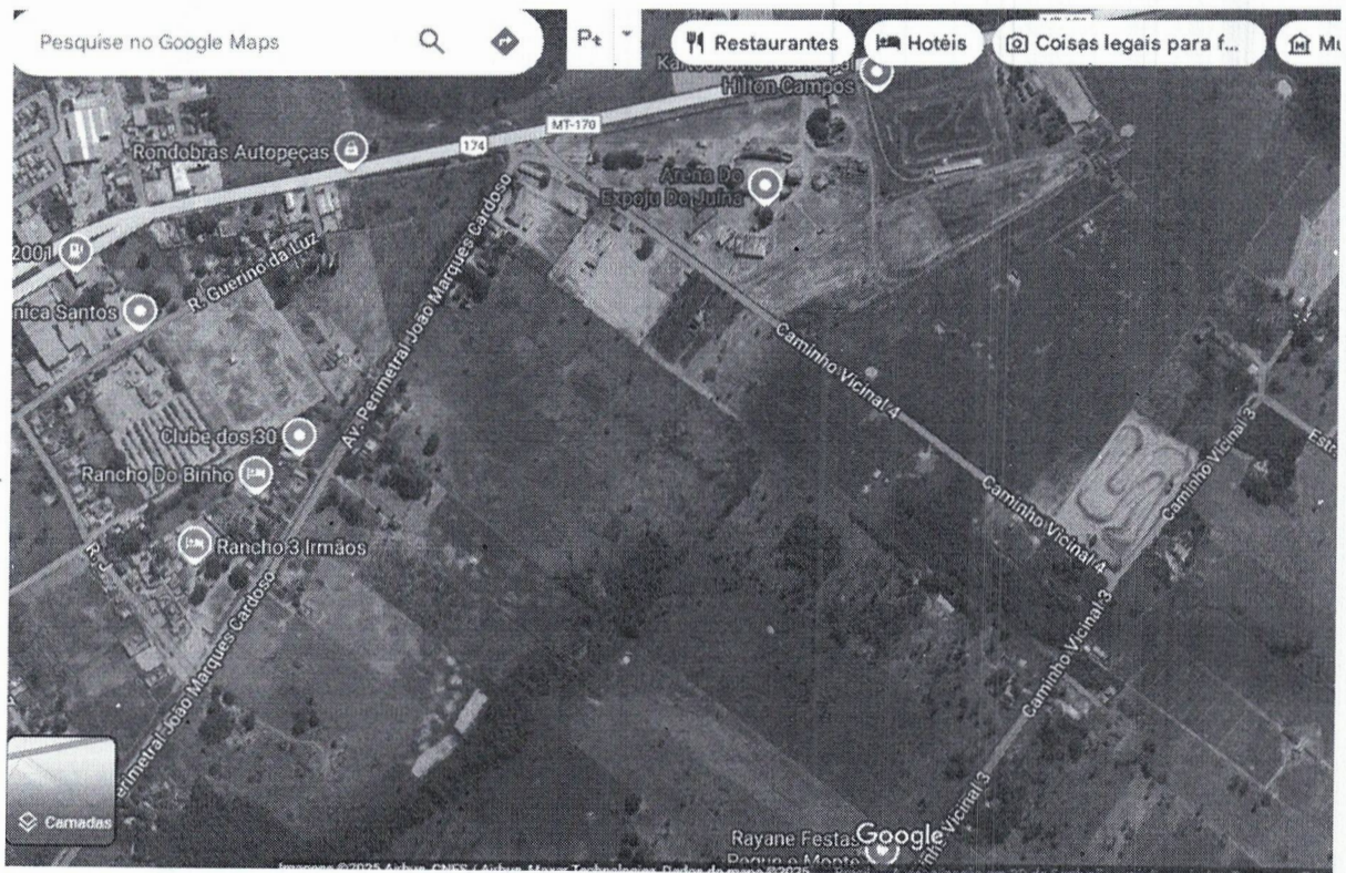
Foto de localização das vicinais 3 e 4