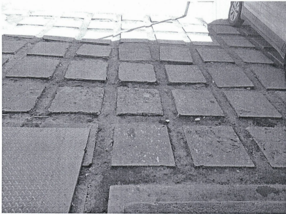
Foto da calçada