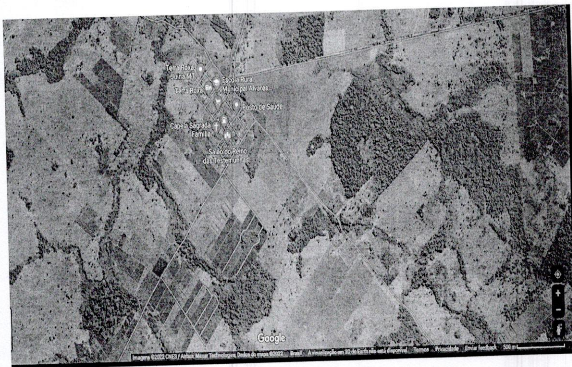
Imagem 1: Imagens de satélite do Distrito de Terra Roxa